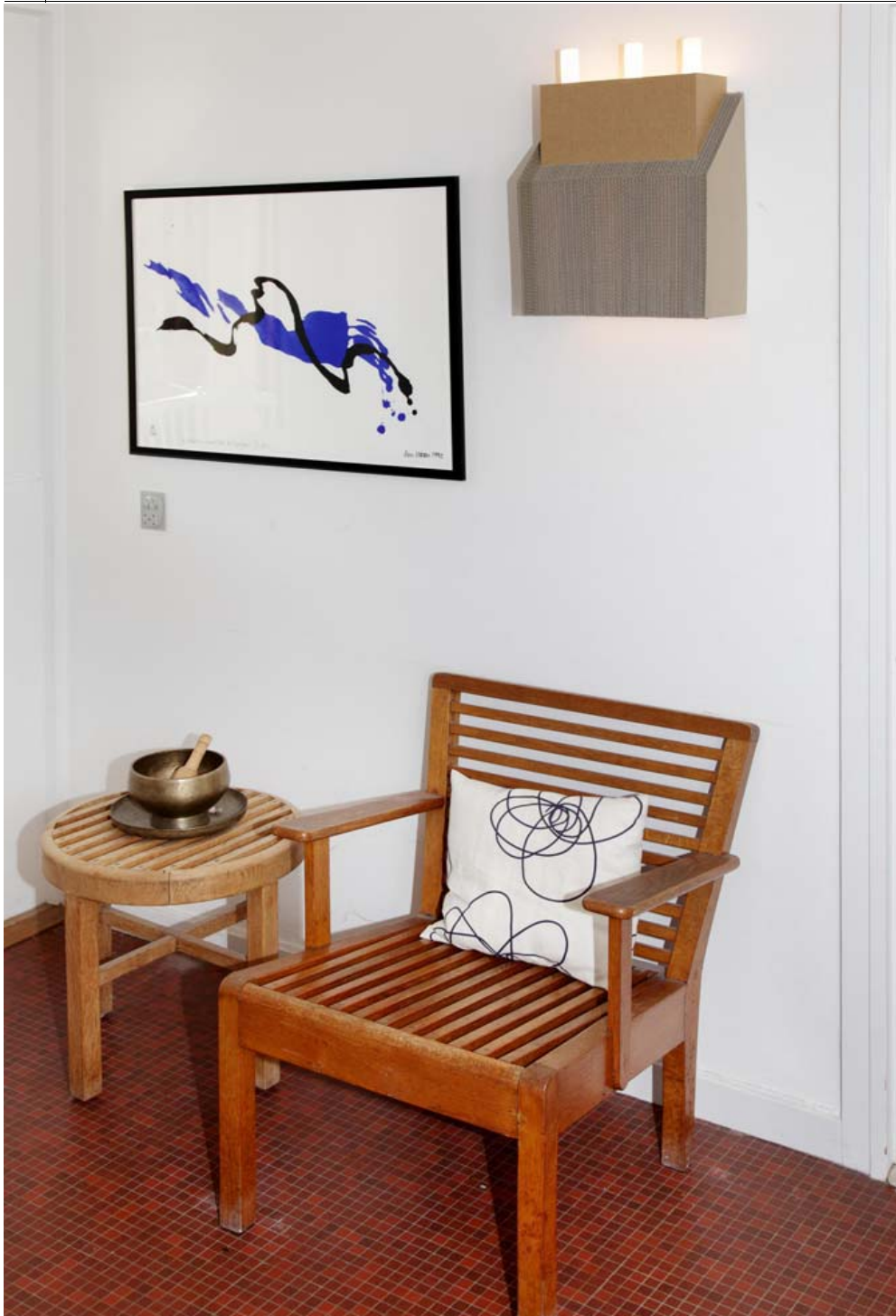
TEGNET TIL HUSET. Stolene og det runde bord er tegnet specielt til huset af arkitekt Frits Schlegel i 1959. Lampen i bølgepap – Svanemølleværket kalder ægtefællen Sofie den – er af eget design. Litografiet fra 1992 er en gave fra kunsthåndværker og tekstildesigner Lin Utzon.