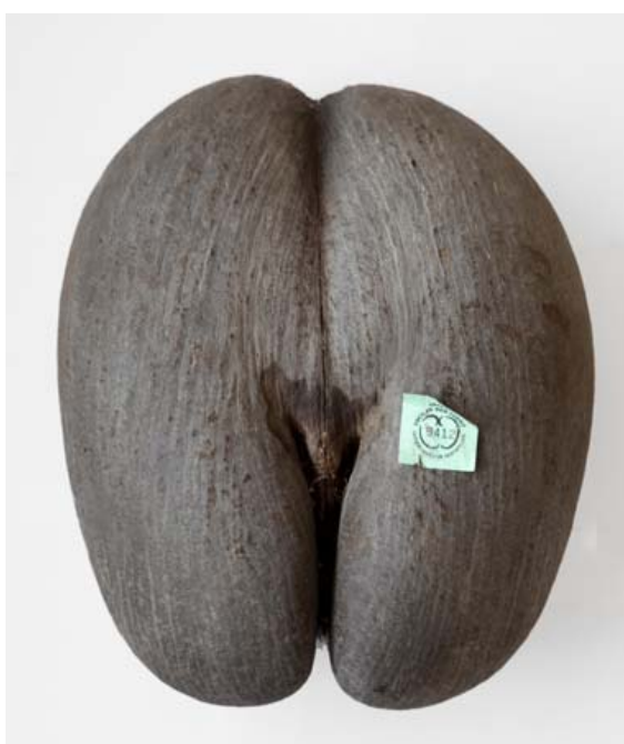
BEDSTE NIPS. Coco de mer er med en vægt på op til 30 kg verdens suverænt største frø. Det kommer fra en særlig palme, der kun vokser på Seychellerne. Hver frugt er omkring seks år om at modne, og en nød må kun føres ud af landet, hvis den er forsynet med myndighedernes officielle certifikat.