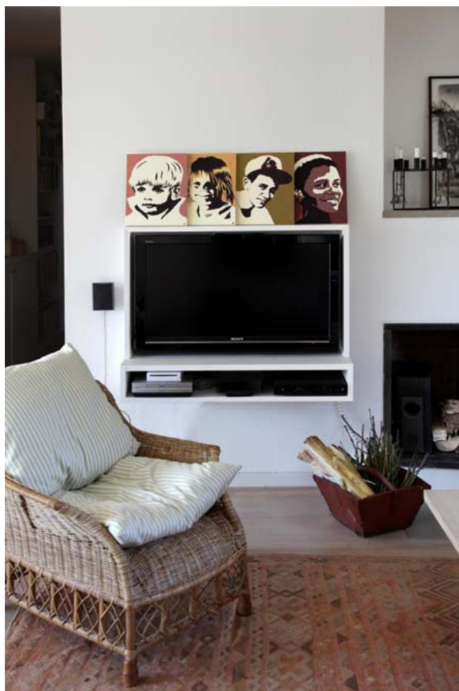
SELV BYG. Morten Paustian har bygget fladskærmen og lydanlægget sammen i en kasse af rå fyrretræsbrædder malet med mat hvid grundmaling. Billederne af børnene er malet af Sofies søster Ida Plum.