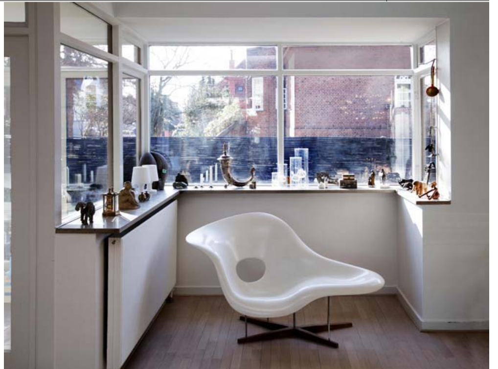
FORMSTØBT. Charles Eames' glasfiberstol La Chaise med kromstel og egetræs fod er tegnet i 1948 og støbt, så den følger kroppens form.