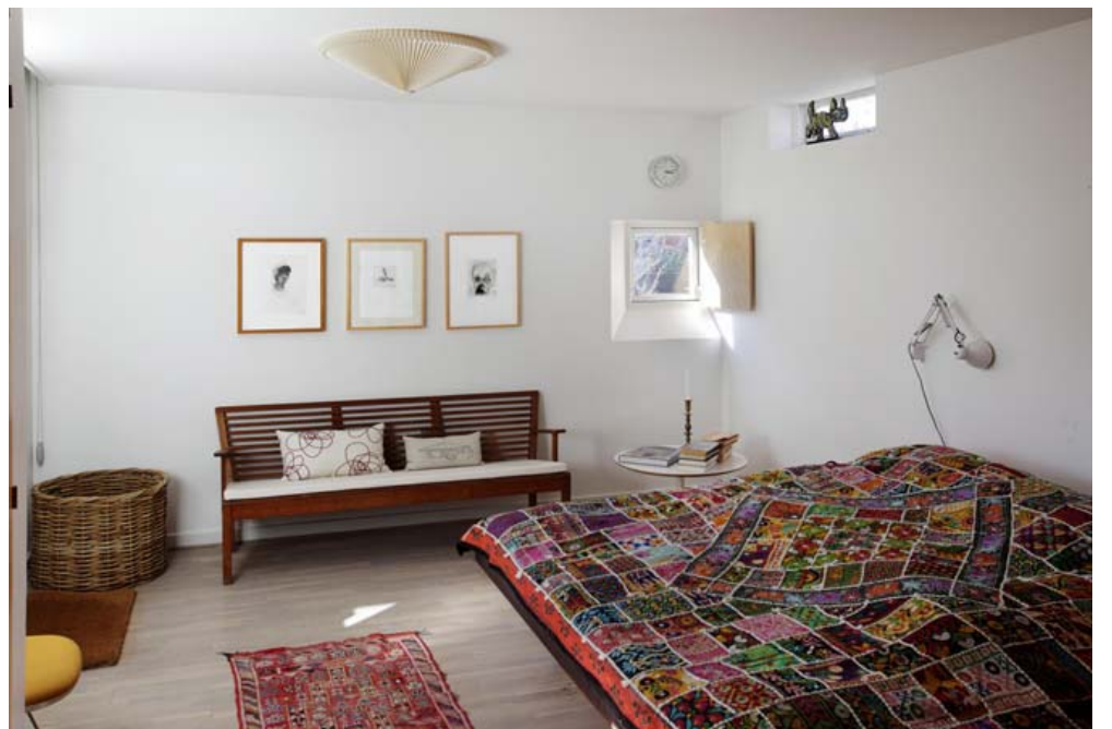
HUSBÆNK. Bænken i soveværelset er tegnet til huset af arkitekt Frits Schlegel. Det lille runde bord er fra 1954, designet af George Nelson og produceret af Herman Miller.